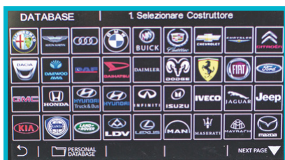
Grafisk database efter mærke

Op til 5 års garanti, hvis der udføres årligt service