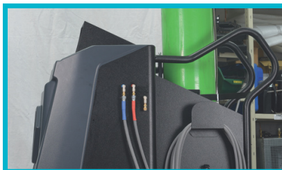
Automatisk styring af alle faser